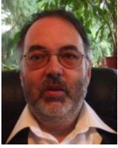
Peter Jung Hof/Ww 02661 / 6 17 05 (nachmittags)

und hier sind Ihre Ansprechpartner/innen!